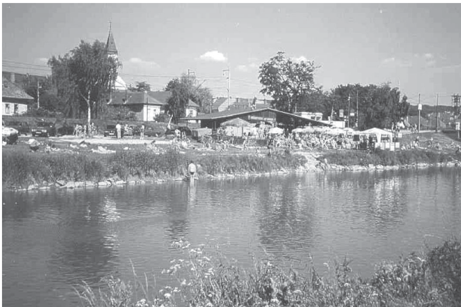
Leto pri Hornáde